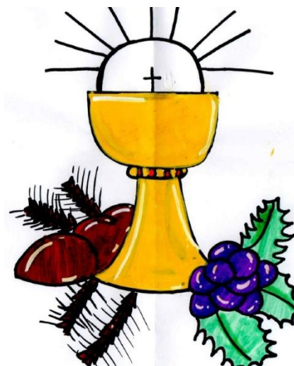
Luana Picco, 3.a

Ove nedjelje u našoj župi održat će se slavlje prve svete pričesti. Dvadesetdevetero djece prvi put primit će Tijelo Kristovo – kruh života koji nam se daruje na oltaru.