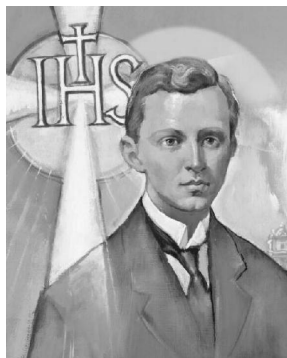
bl. Ivan Merz – 10. svibnja

Udijeli i nama, a posebno našim ovogodišnjim prvopri esnicima i firmanicima, da, oja ani njegovim zagovorom i potaknuti njegovim primjerom, vjerno i hrabro nastavimo navješ ivati Evan elje i za nj svjedo iti. Po Kristu Gospodinu našem. Amen.